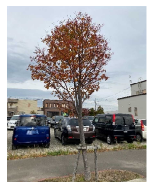
東雁来 アズキナシ