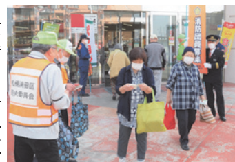
火災予防運動の様子

各町内会や事業所などで、火災予防の話や消防訓練の指導を行っています。春・秋の火災予防運動期間には呼びかけを強化して、住民の方と協力し火災予防広報に努めています。