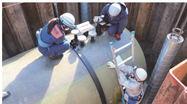
埋める前の地下タンク

ガソリンスタンドなどが安全に造られているか検査し、危険物の正しい取り扱い方を指導します。危険物が漏れるなどの事故があれば原因を調べ、同じような事故の再発防止を図ります。