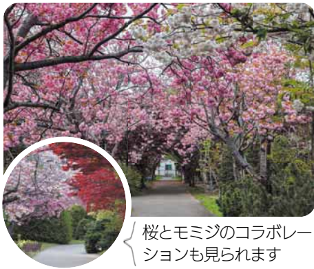
桜とモミジのコラボレーションも見られます