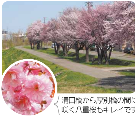
清田橋から厚別橋の間に咲く八重桜もキレイです