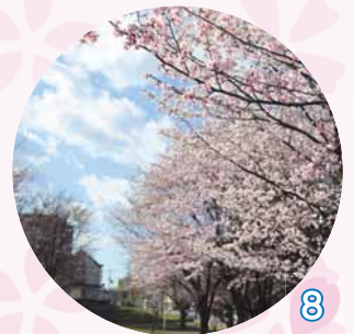
清田元町さくら台公園