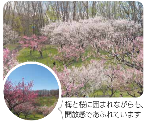
梅と桜に囲まれながらも開放感であふれています