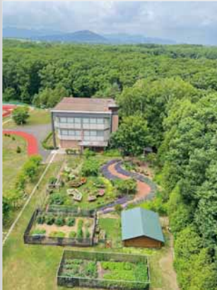
(イネーブルガーデン)