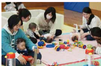
(ハロー！あかちゃん0さいの様子)