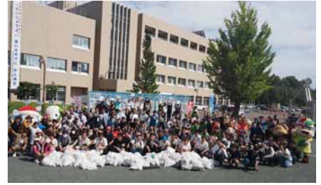
(第11回ほっかいもっかい杯)