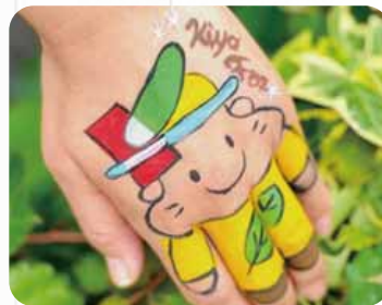
フェイスペイント(有料) ※顔や手などに描くことができます