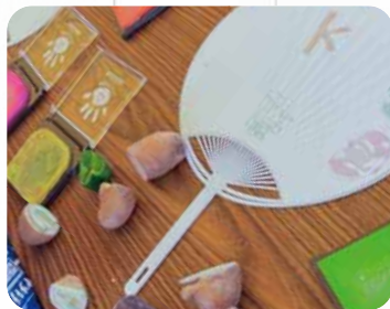
野菜ハンコで作品制作