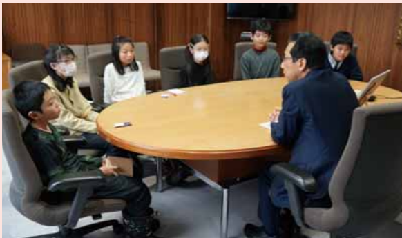
▲昨年度開催時の対話の様子

今回は、市長に聞いてみたいことや「こうだったら良いな」と思う札幌の未来を、市長と話し合う小学4～6年の参加者を募集します。参加者は、市長の椅子に座って記念撮影も行います。