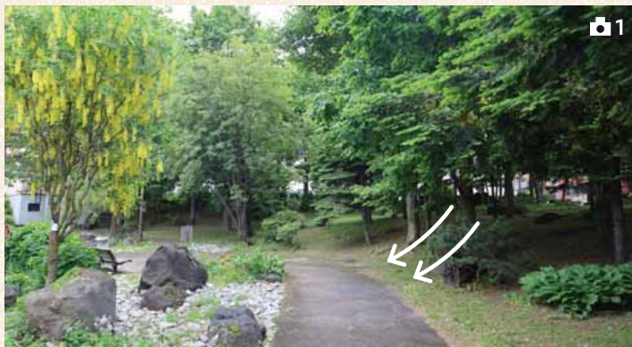
▲右から左にかけて土地が低くなっており、地下水が湧き出やすかった